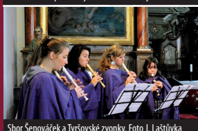
Sbor Senováček a Týršovské zvonky.