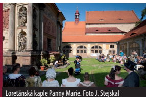
Loretánská kaple Panny Marie.

sobota 15. 9. 2012, 10.00-17.00 hod. loretánský areál v Rumburku